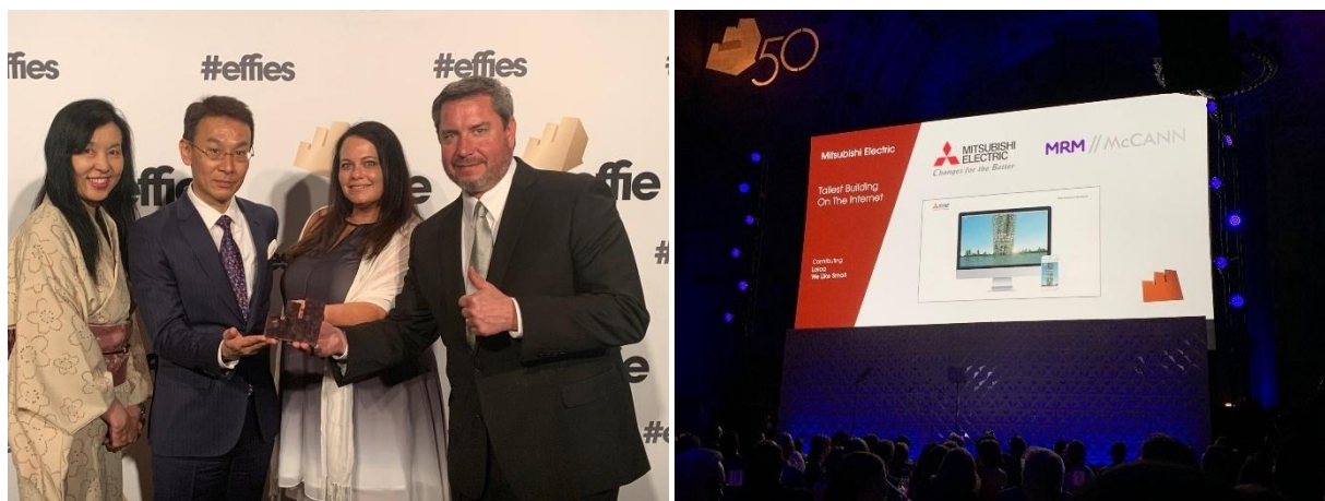
Effie Awards-utdelingen (lokal tid den 30. mai 2019 : I New York • Effie US GALA)

TOKYO, 3. juni 2019 – Mitsubishi Electric Corporation (TOKYO: 6503) kunngjorde i dag at Mitsubishi Electric US, Inc.s nettsted Building Solutions har fått bronse i Business-to-Business-kategorien (BtoB) i Effie Awards, en internasjonal pris som anerkjenner fortreffelighet innen reklame. Mitsubishi Electric er den eneste vinneren av BtoB-kategorien dette året, og dette antas å være første gang at en japansk elektronikkprodusent har fått Effie-priser i denne kategorien.