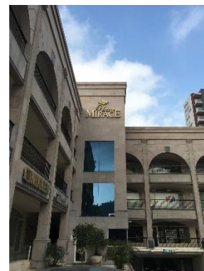
Mexico Monterrey FA Center, som befinner seg i Monterrey-kontoret til Mitsubishi Electric Automation, Inc.

Investeringer i produksjon er i ferd med å øke i Mexico, blant annet innen elektro- og elektronikksektoren. Trenden forventes å bidra til økt behov for FA-enheter og et bredt spekter av relaterte tjenester.