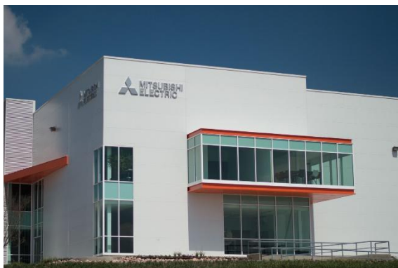
Mexico FA Center, som befinner seg i Querétaro-kontoret til Mitsubishi Electric Automation, Inc.

TOKYO, 12. mai 2017 – Mitsubishi Electric Corporation (TOKYO: 6503) kunngjorde i dag at Mexico-divisjonen har etablert to nye servicefasiliteter for fabrikkautomatisering (FA) – Mexico FA Center i Querétaro og Mexico Monterrey FA Center i Nuevo Leon. Med det utvidede nettverket vil Mitsubishi Electric være i stand til å styrke og akselerere kundestøtte samt utføre service på FA-produkter i Mexico. Begge sentrene vil være i drift fra 15. mai.